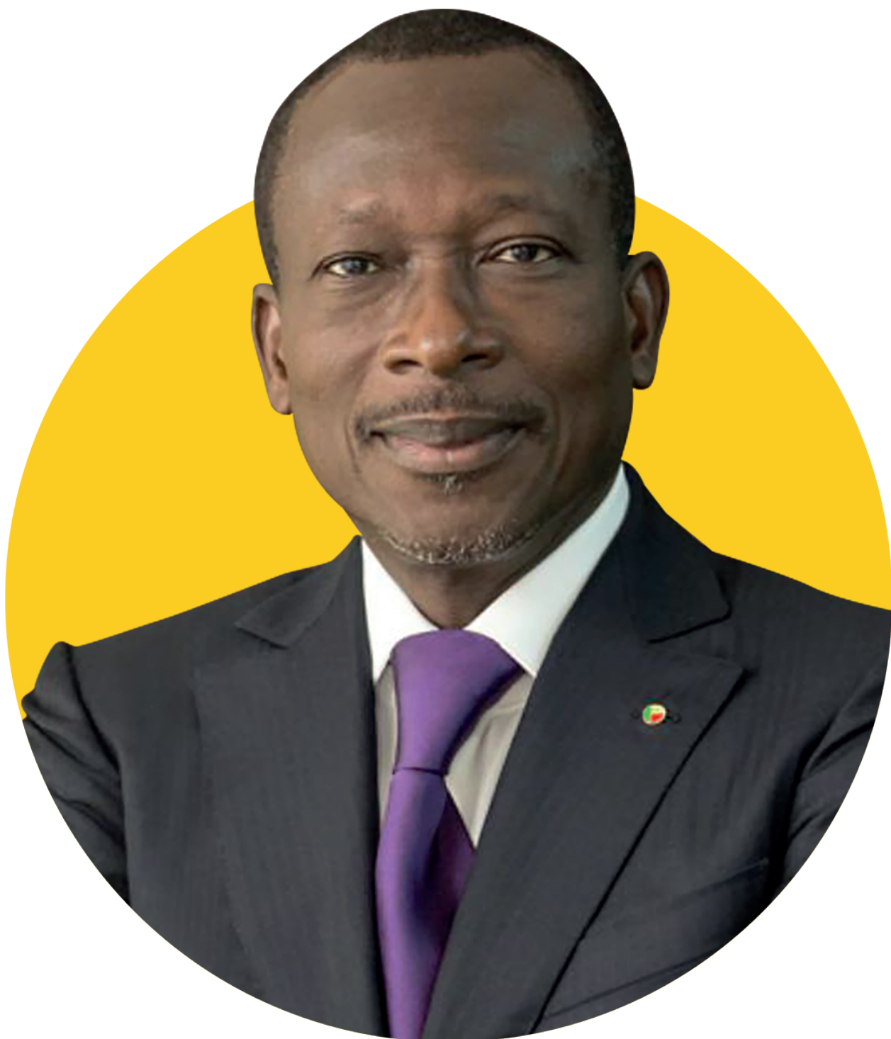
S.E. PATRICE TALON President de la République du Bénin Chef de l'Etat