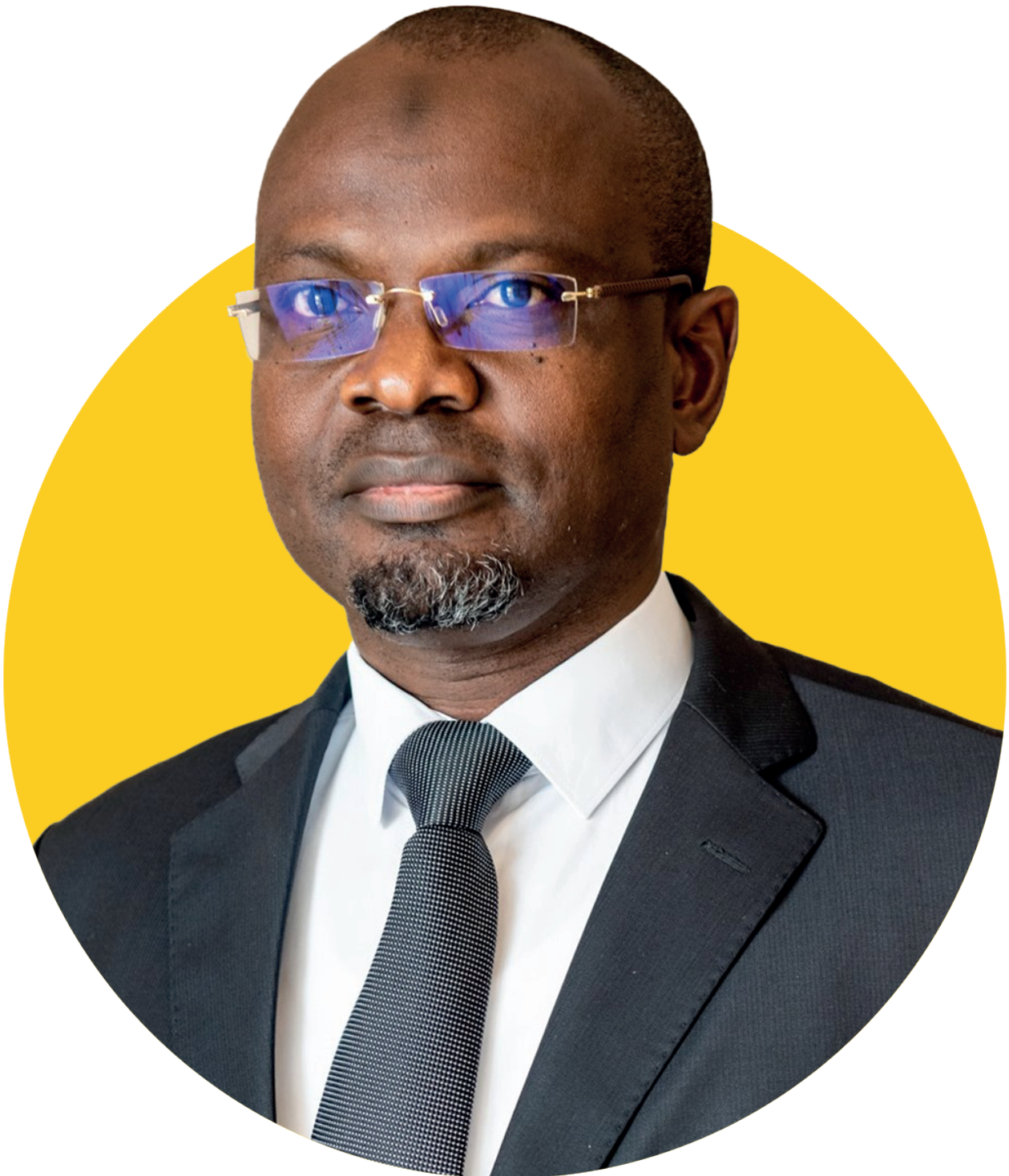
SAMOU SEIDOU ADAMBI Ministre de l'Énergie, de l'Eau et des Mines de la République du Bénin