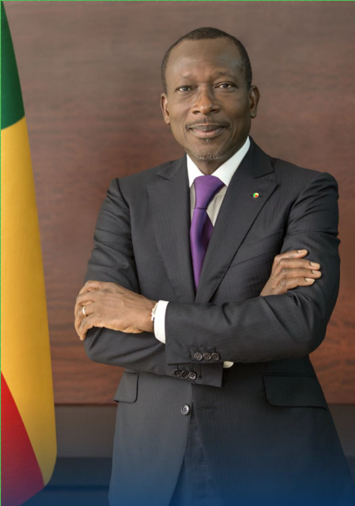
Son Excellence Patrice TALON President de la République du Bénin Chef de l'Etat